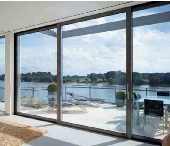
Schüco Hebe-Schiebesystem ASS 70.HI Schüco lift-and-slide system ASS 70.HI